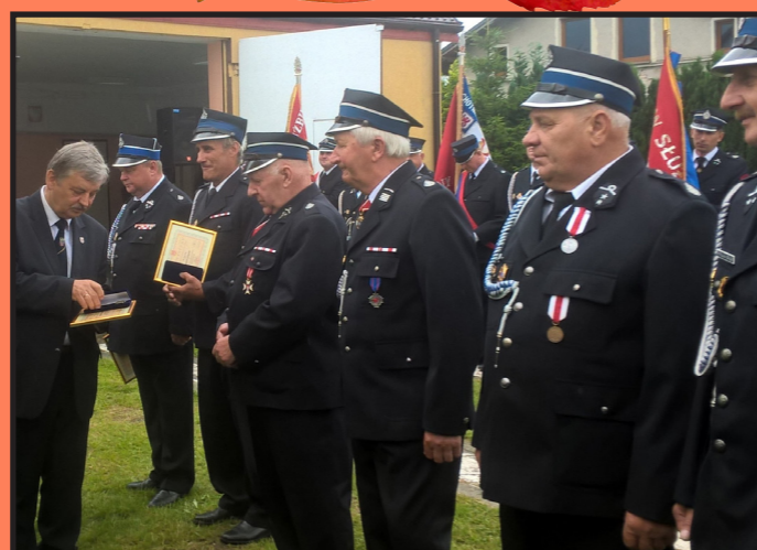
70 - lecie Ochotniczej Straży Pożarnej w Dargobądzu