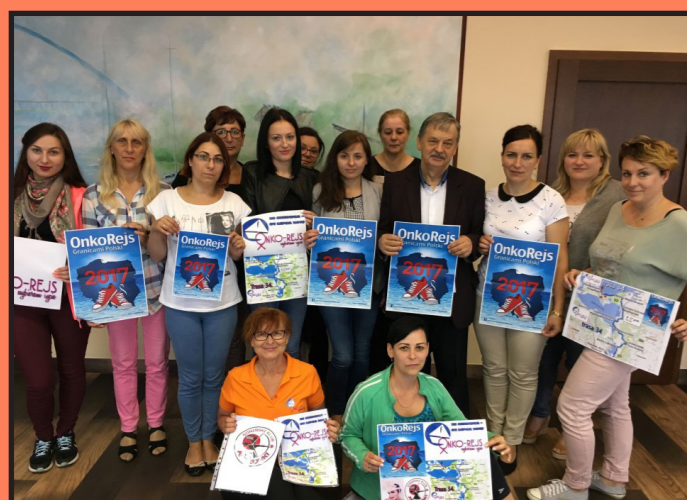
Marsz Onko-Rejs Granicami Polski w Wolinie