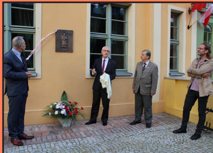
1050. rocznica przyłączenia Wolina do Polski