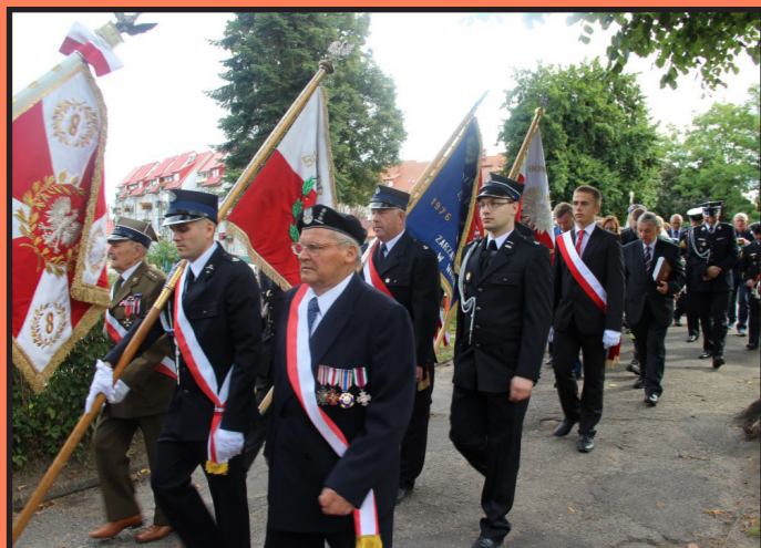
78. rocznica wybuchu II wojny światowej