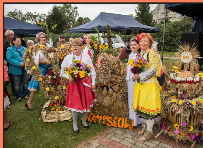
Gminne Dożynki w Skoszewie