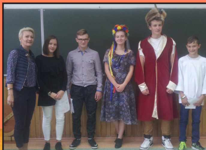
Narodowe Czytanie w Publicznej Szkole Podstawowej w Wolinie