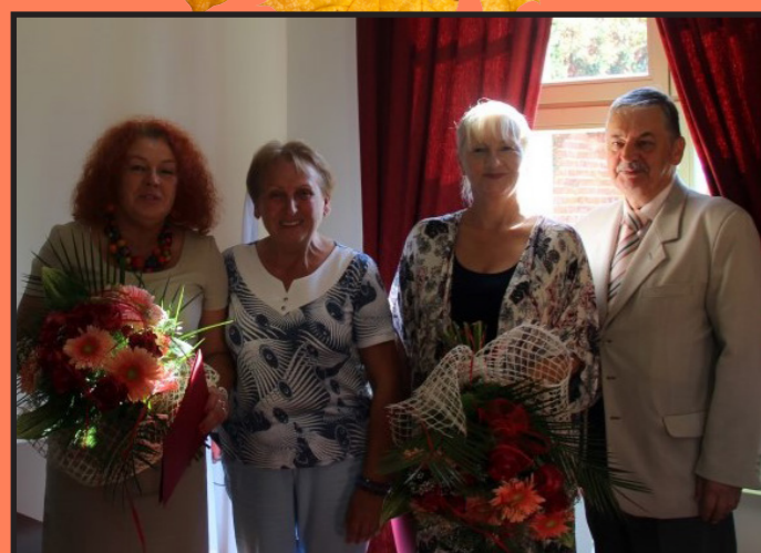
Podziękowania dla Dyrektorów Publicznych Gimnazjów z gminy Wolin