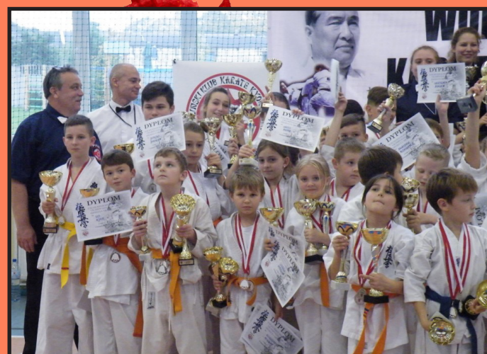
Zachodniopomorska Olimpiada Karate Dzieci i Młodzieży w Wolinie