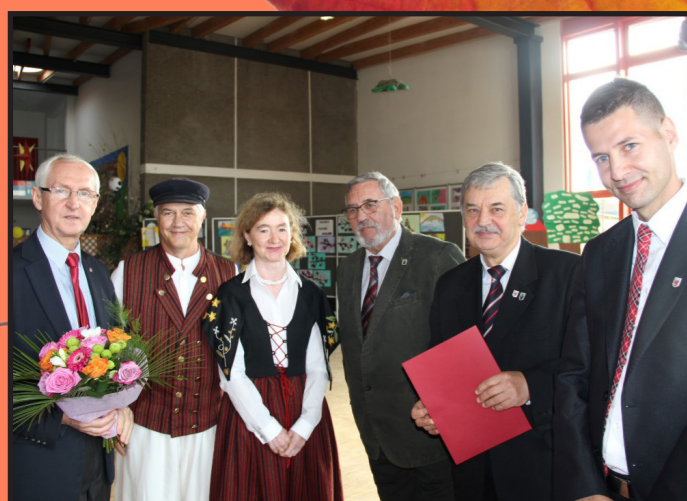
W Usedom świętowano 27. rocznicę Zjednoczenia Niemiec