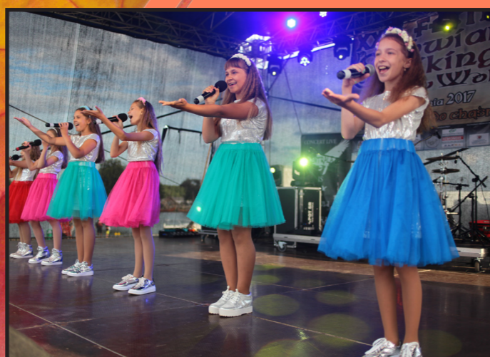
Kolejny rok z Karawaną Kultury