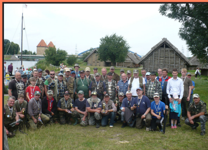
Międzynarodowe Zawody Wędkarskie Spławikowe o Puchar Burmistrza Wolina